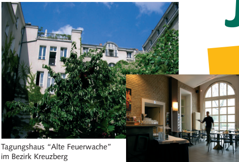
Tagungshaus "Alte Feuerwache" im Bezirk Kreuzberg

Stets in der ersten Woche der Sommerferien bietet die Friedensgemeinde eine thematische Reise für Jugendliche zwischen 12 und 18 Jahren an. Immer? Fast immer. Einzige Ausnahme stellte das Pandemie-Jahr 2020 dar, wir durften wegen der Corona-Pandemie nicht fahren. Also versuchen wir es für 2021 noch einmal: Mit etwas Glück wird es vielleicht in diesem Sommer klappen? Es könnte eine der ersten Reismöglichkeiten nach hartem Lockdown sein. Gleich am ersten Tag der Sommerferien, vom 22. bis 28. Juli, soll es nach Berlin gehen. Die Teilnahme steht allen Interessierten dieser Altersgruppe offen. Unterkunft bietet das Tagungshaus "Alte Feuerwache" in Kreuzberg. Es wird Ausgangspunkt sein für Streifzüge durch die Hauptstadt.